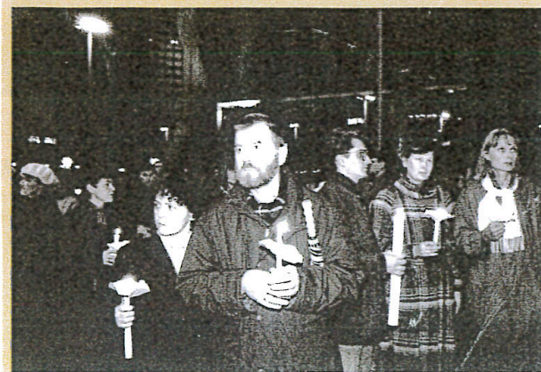
Sotto: nell'autunno del 1989 le candele diventano in tutta la Germania orientale simbolo della protesta. Qui la manifestazione del 18 dicembre a Lipsia.