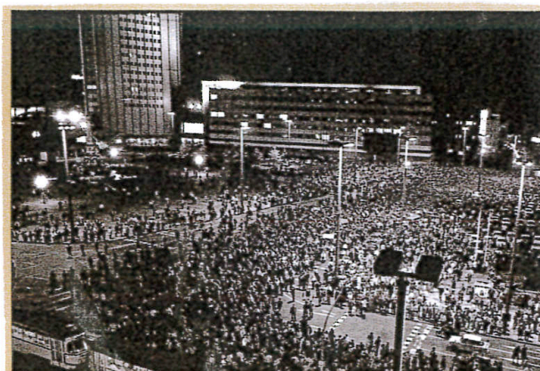
Sopra: Lipsia, 16 ottobre 1989: il lunedì successivo il numero dei manifestanti è quasi raddoppiato.