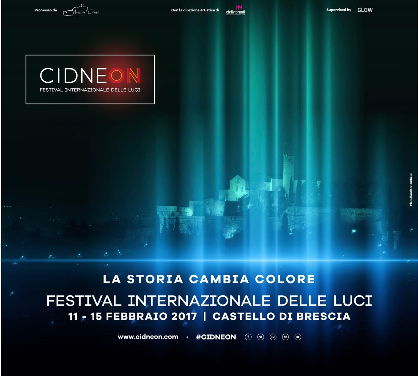
Ph. Rolando Giambelli